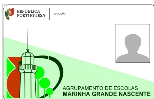
Exemplar de um cartão